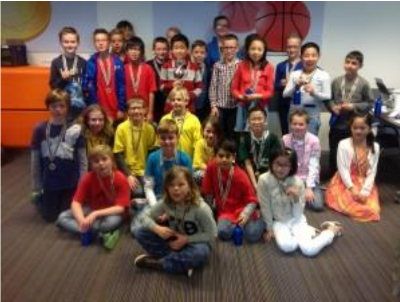
De deelnemers aan de Zuid Holland Cup